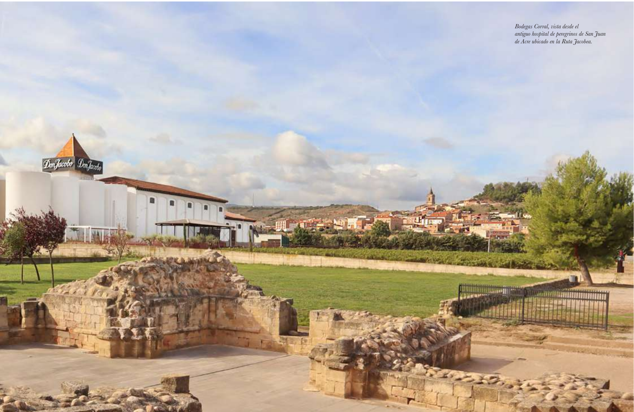
Bodegas Corral, vista desde el antiguo hospital de peregrinos de San Juan de Acre ubicado en la Ruta Jacobea.